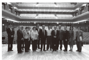
2013年12月 各地で開催される地域懇談会では、様々な地域課題や関係各位のご努力を実感しました。