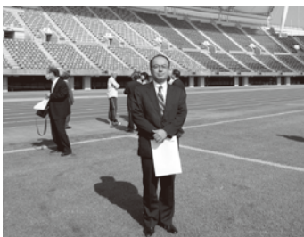
2013年10月 仙台市議会市民教育常任委員長として、委員の皆様と熊本市のスポーツ施設を視察しました。